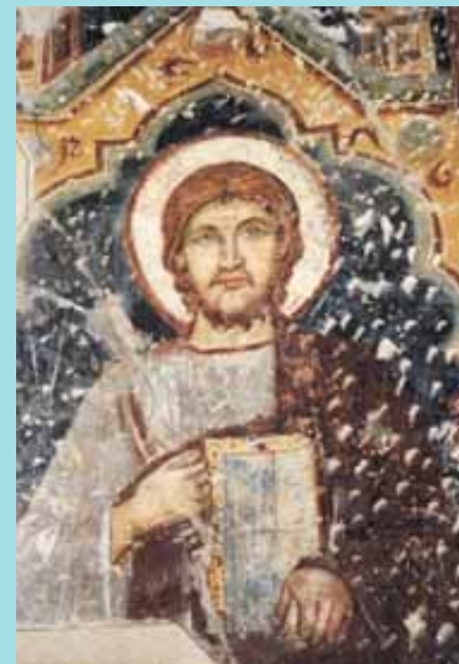
S. Marco evangelista (affresco nella Chiesa di S. Marco in Brescia, sede dell'Opera)

Brescia - Chiesa di S. Marco - Piazzetta S. Marco, 1