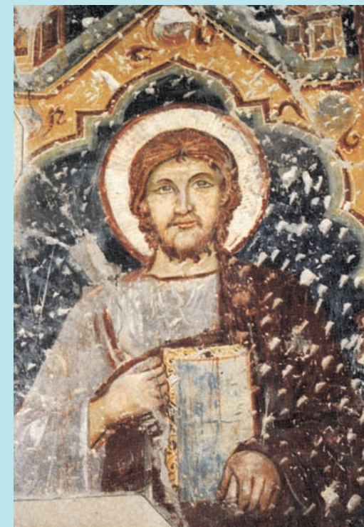
S. Marco evangelista (affresco nella Chiesa di S. Marco in Brescia, sede dell'Opera)

Brescia - Chiesa di S. Marco - Piazzetta S. Marco, 1