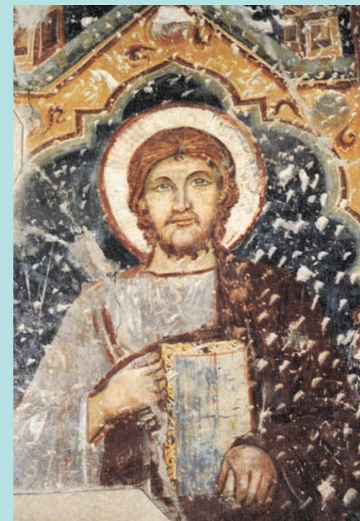
S. Marco evangelista (affresco nella Chiesa di S. Marco in Brescia, sede dell'Opera)

Brescia - Chiesa di S. Marco - Piazzetta S. Marco, 1