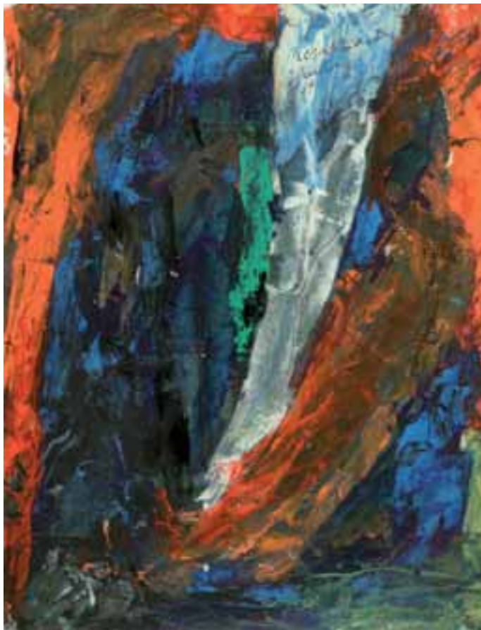
J. Guitton, Rexurrexit , 1969, Brescia, Coll. Arte e Spiritualità

3. Analizzando questi testi-chiave della Bibbia, fino alla radice stessa dei significati che racchiudono, scopriamo appunto quell'antropologia che può essere denominata "teologia del corpo". Ed è questa teologia del corpo che fonda poi il più appropriato metodo della pedagogia del corpo , cioè dell'educazione (anzi dell'autoeducazione) dell'uomo. Ciò acquista una particolare attualità per l'uomo contemporaneo, la cui scienza nel campo della biofisiologia e della biomedicina è molto progredita.