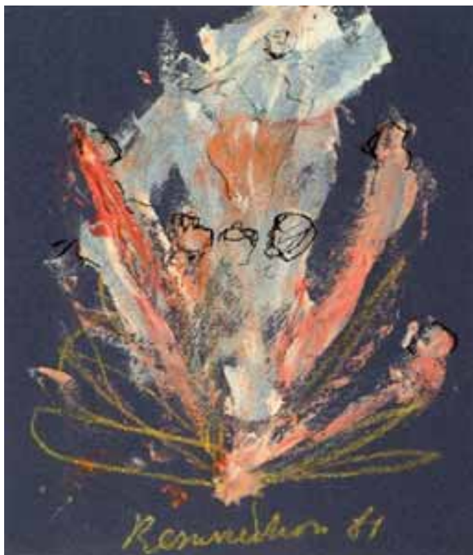
J. Guitton, Résurrection , 1961, Brescia, Coll. Arte e Spiritualità

Vi offriamo qui di seguito alcune riflessioni di Giovanni Paolo II tratte dalla Teologia del Corpo , opera che raccoglie le Udienze generali dei primi cinque anni del suo pontificato, interamente dedicate a riflettere sul senso dell'esistenza umana e sul significato dell'essere una persona umana così come esso deriva dalle Sacre Scritture.