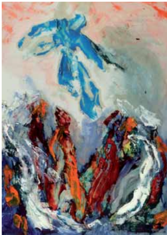
J. Guiton, Ascensione , 1971 Brescia, Coll. Arte e Spiritualità

Ma ancor più, può aiutare la lettura dell'identità del Servo del Signore in prospettiva cristiana, la risposta che il diacono Filippo offre all'eunuco etiope, che gli aveva domandato a partire dalla lettura di Is 53,7-9: «Per favore, di chi il profeta dice questo? Di se stesso o di un altro». L'autore degli Atti annota: «Filippo prese la parola e a partire da quel passo gli annunciò l'evangelo di Gesù» (At 8,34). In sostanza l'esperienza del Ser-