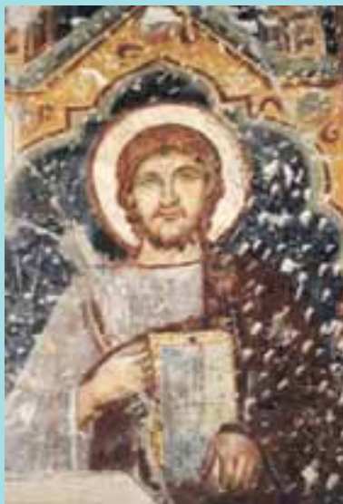
S. Marco evangelista (affresco nella Chiesa di S. Marco in Brescia, sede dell'Opera)