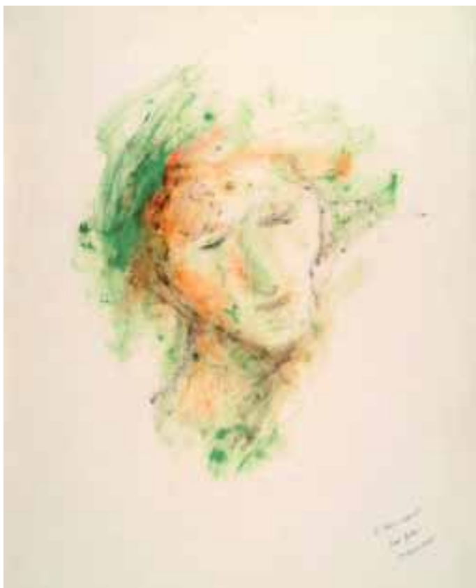
J. Guitton, Le Christ ressuscité , 1975 Brescia, Coll. Arte e Spiritualità

no che dire, il testo pare suggerire che davanti al Servo solo il silenzio può permettere una comprensione della sua identità e della sua missione ovvero del mistero che si opera da parte di Dio nella sua vita in favore delle moltitudini ( rabbim ).