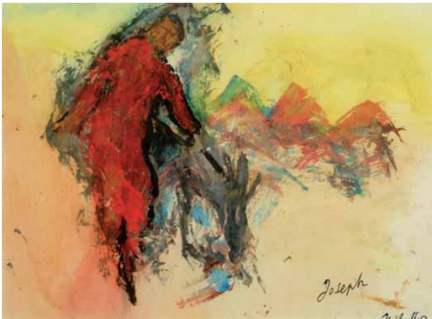
J. Guitton, Joseph , [1971], Brescia, Coll. Arte e Spiritualità