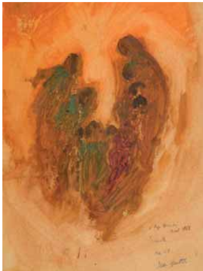
J. Guitton, pentecôte , 1959, Brescia, Coll. Arte e Spiritualità

In primo luogo, l'impiego del verbo parístemi 15 con valore ingressivo è inequivocabile se si considera la sua correlazione con il termine thysían . È questo, infatti, ad evidenziare una esplicita connotazione sacrificale propria del culto ebraico. Il vocabolo procede verso una significazione cruenta e fisica.